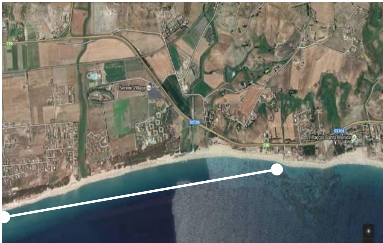
Fotogrammi "GoogleMap" campo gara "JUNIORES" - Loc. Annunziata le Castella -SOLO UN SETTORE-